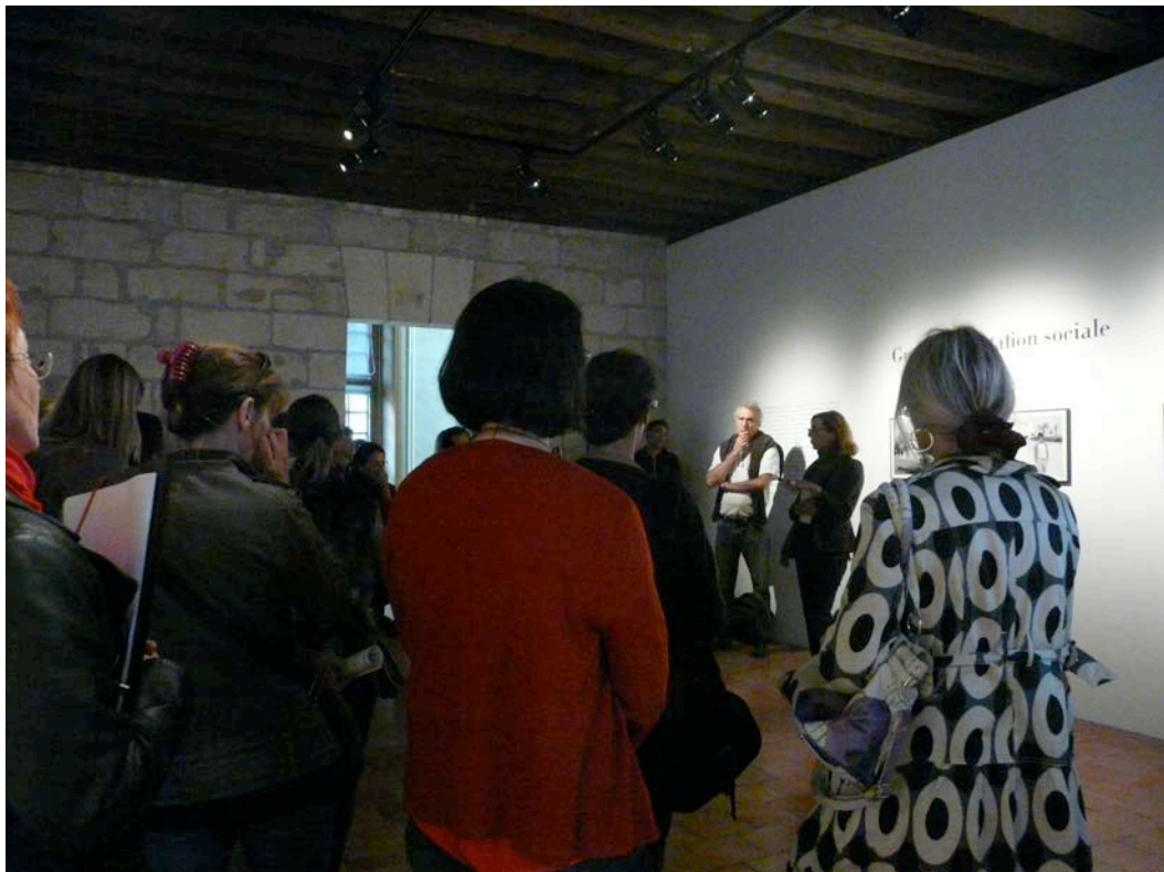
Rencontre académique de l'exposition « Pierre Bourdieu. Images d'Algérie. Une affinité élective », le 19 septembre 2012.

Après la visite des expositions du CCC et du Jeu de Paume hors les murs au Château de Tours, le projet architectural du nouveau centre d'art de Tours sera dévoilé à la classe. Un atelier en classe sera ensuite consacré aux enregistrements sonores des paroles des enfants. Sous la forme d'interviews conçues et réalisées par eux-mêmes, les enfants s'exprimeront et partageront leurs idées sur ce qu'ils aimeraient trouver dans ce nouveau centre d'art et sur ce qui changera dans leur ville autour de la construction de ce nouveau bâtiment.