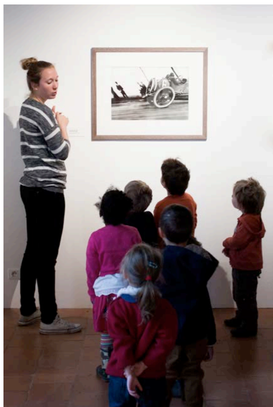
Visite commentée de l'exposition " Lartigue, l'émerveillement (1894-1936) " au Château de Tours, réalisée par les étudiants de la formation à la médiation CCC / Jeu de Paume / Université François Rabelais / Ville de Tours, 2013. Photographie exposée : Jacques Henri Lartigue " Grand Prix de l'ACF, automobile Delage, circuit de Dieppe, 26 juin 1912 "