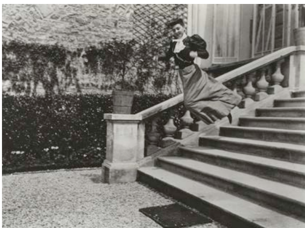
Jacques Henri Lartigue, Bichonnade, 40, rue Cortambert, Paris, 1905 Tirage gélatino argentique.

« Depuis que je suis petit, j'ai une espèce de maladie : toutes les choses qui m'émerveillent s'en vont sans que ma mémoire les garde suffisamment », constate Lartigue dans son journal de l'année 1965. Émerveillement et mémoire qui flanche, passion pour la vie et blessure secrète devant l'impermanence des choses, il n'en faut pas plus à Lartigue pour glaner et collectionner pendant 80 ans ces milliers d'instant fugitifs dont il saura nous montrer la beauté. L'exposition présente, en grands formats, 136 photographies qui ont contribué à construire sa célébrité. Elles ont été choisies dans les 135 grands albums mis en page et légendés par Lartigue, (un journal en images qui couvre le XX e siècle avec ses 14 423 pages), et seront complétées par des citations extraites de son journal et une sélection de facsimile de documents (albums, agendas illustrés de croquis, journal manuscrit, plaques négatives et positives), permettant d'approcher la démarche de Lartigue au plus près.