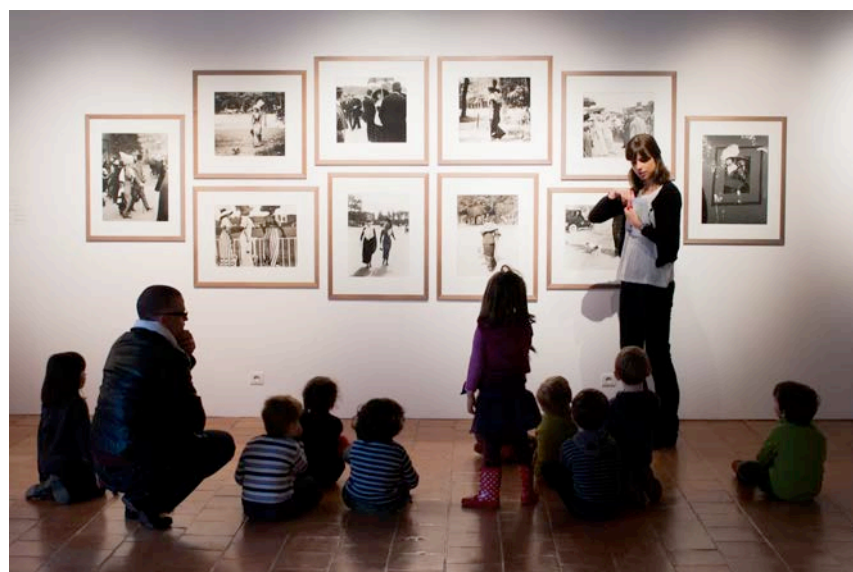
Visite commentée de l'exposition "Lartigue, l'émerveillé (1894-1936)" au Château de Tours, réalisée par les étudiants de la formation à la médiation CCC / Jeu de Paume / Université François Rabelais / Ville de Tours, 2013. Photographies exposées : Jacques Henri Lartigue

Les conférenciers accueillent et accompagnent les classes dans la découverte des expositions, tout en favorisant l'observation et la prise de parole des élèves. Ces visites commentées permettent aux élèves de s'appropriier les œuvres et d'être en position active devant les images.