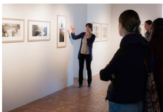
Rencontre académique autour de l'exposition « Lartigue, l'émerveillé (1894-1986) »

133 enseignants ont participé aux visites des expositions dans le cadre de « rencontres académiques »