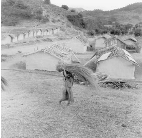
Pierre Bourdieu, Cheraïa. Centre de regroupement en construction