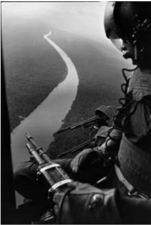
Viêtnam, division hélico, novembre 1967