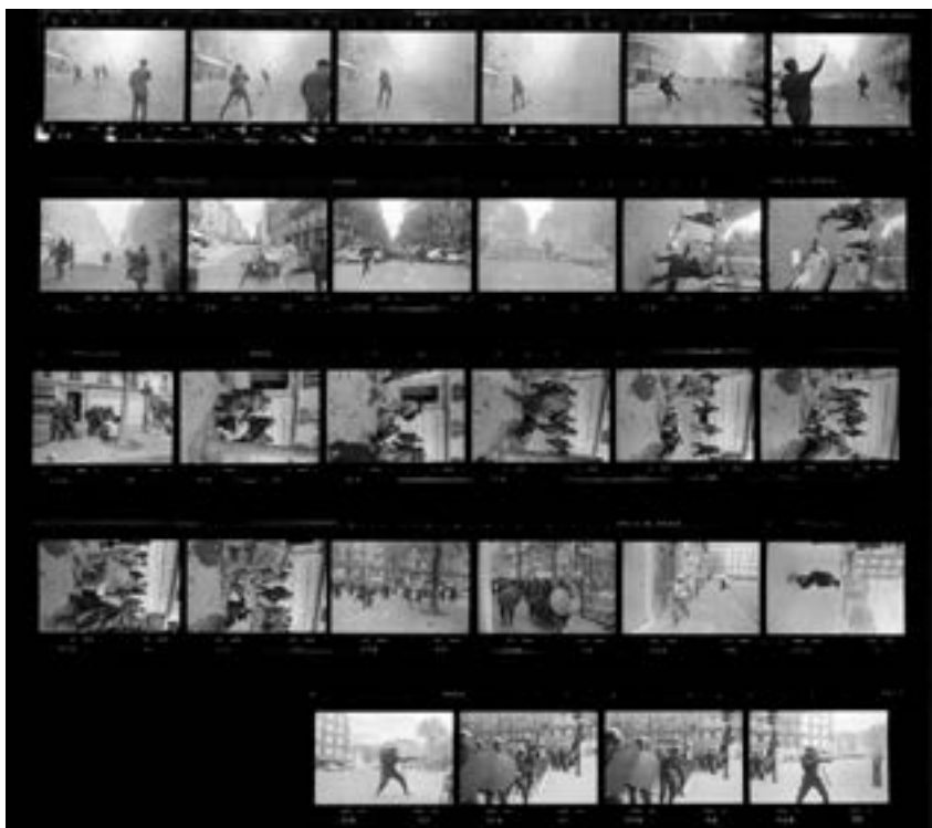
Manifestations, Paris, mai 1968