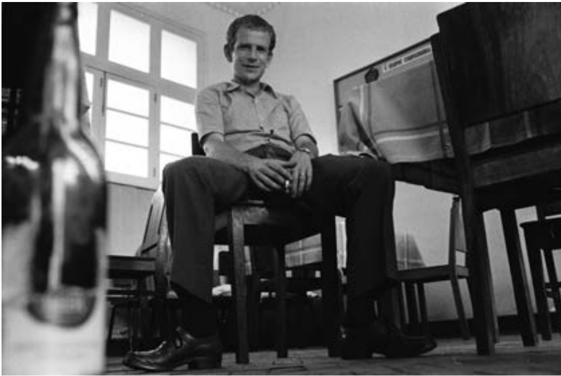
Guerre du Biafra, Gilles Caron, autoportrait, juillet 1968