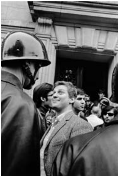
Daniel Cohn-Bendit face aux CRS, devant la Sorbonne, 6 mai 1968

publié en petit format en 1950 dans la rubrique "Speaking of Pictures" de Life . Parmi les six illustrations du reportage, cette image fait partie de celles auxquelles ont été réservées le plus petit format. Dotée d'une faible valeur scalaire, elle ne fait alors l'objet d'aucun commentaire ni d'aucune réappropriation. Quelles que soient ses qualités formelles, sa taille modeste, qui suggère une importance réduite, ne peut éveiller l'attention ni légitimer une lecture approfondie. Il est absurde de tenter d'analyser une photo de presse avec les outils du formalisme pictural. Le cadre médiatique impose des règles autonomes, qui en modifient la perception en profondeur. Les prix du photojournalisme ne distinguent pas les images en fonction de critères formels, mais en raison de l'exemplarité de la traduction visuelle d'un événement de valeur médiatique élevée. La valeur scalaire d'une photographie, dépendante d'une occurrence éditoriale et non établie dans l'absolu, définie par l'éditeur et non par le photographe, est le moteur primordial du travail interprétatif. »