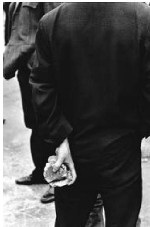
Manifestations, Londonderry, Irlande du Nord, août 1969

1939 · Naissance à Neuilly-sur-Seine (Hauts-de-Seine), de père français et de mère écossaise.