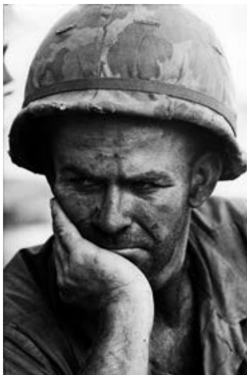
Bataille de Dak To, Vietnam, soldat américain, novembre-décembre 1967 Collection Succession Gilles Caron