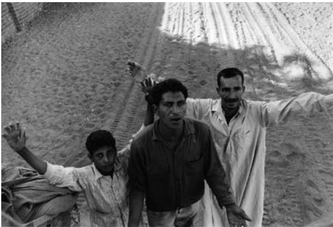
Guerre des Six Jours, victimes civiles, juin 1967

les points de vue, les choix formels. Les comparer au regard que Gilles Caron a porté sur cette guerre, en s'appuyant sur les photographies de ses reportages en 1967. Que montre Caron ? Quels choix (sujets, distances, cadrages, points de vue) effectue-t-il ?