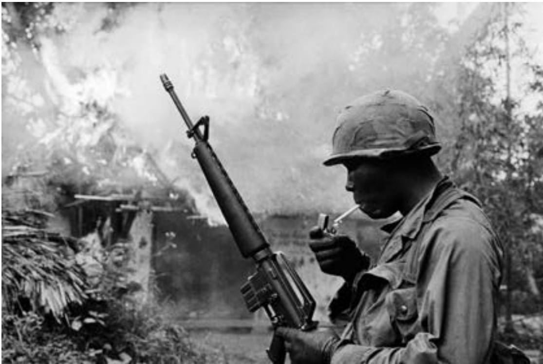
Guerre du Viêt Nam, combats sur la colline 875, Dak To, novembre-décembre 1967