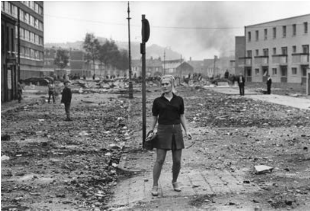
Après un affrontement entre manifestants catholiques et la police de l'Ulster, Irlande du Nord, août 1969