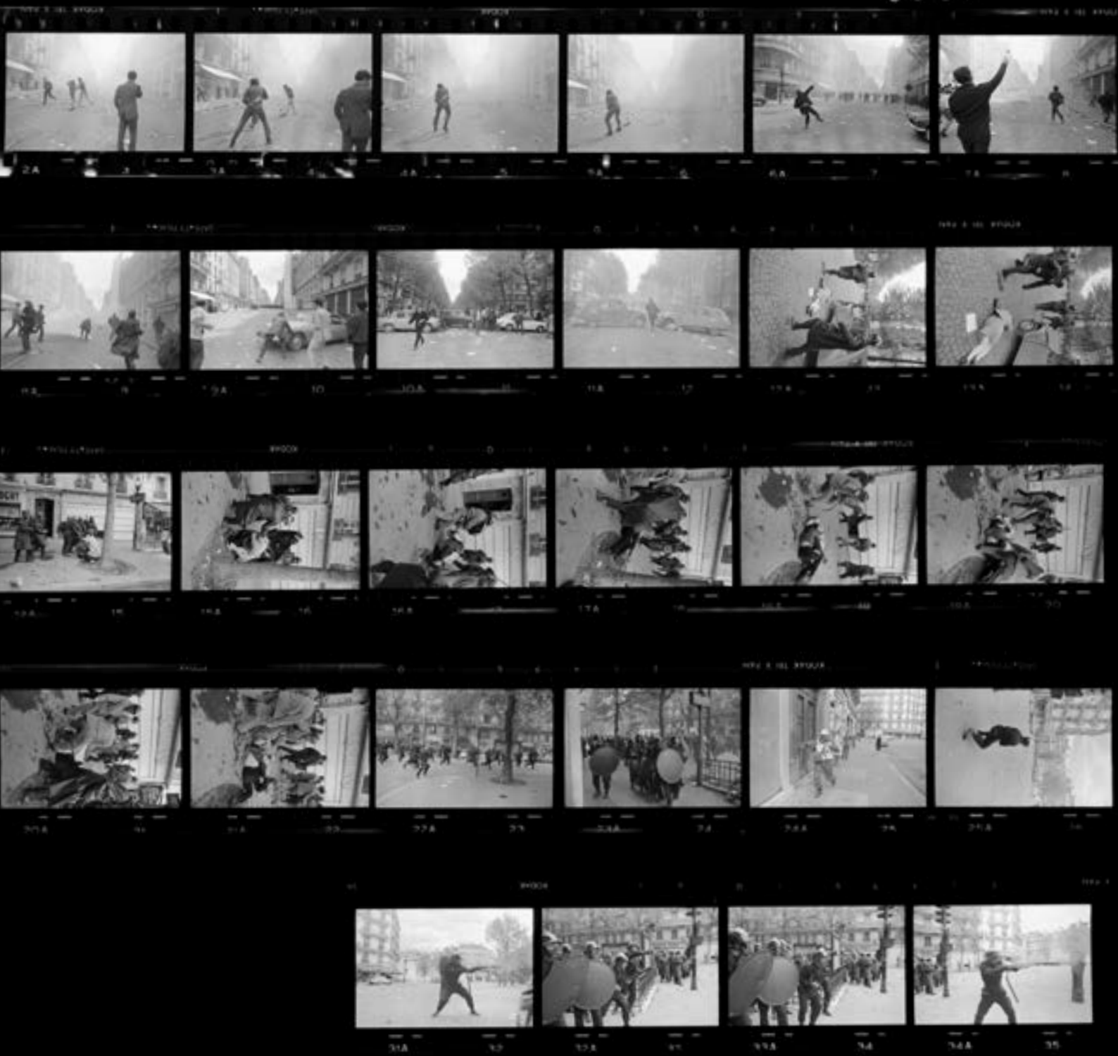
Manifestations, Paris, mai 1968