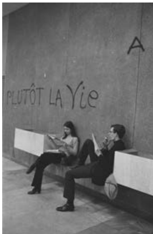
Grève des étudiants, université de Nanterre, près de Paris, mars 1968

Distinguer les images photographiques isolées et les images photographiques publiées dans un contexte médiatique. Étudier les modalités de publication d'une image et analyser leurs effets sur la réception et l'interprétation de sa signification.