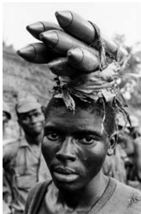
Guerre du Biafra, soldat biafrais, 1968

Si l'on recoupe ces considérations avec la conception de l'histoire dont nous sommes les héritiers – la "Nouvelle histoire" donc – que comprenons-nous ? L'événement, on le sait, a fait "retour" dans la conscience des historiens