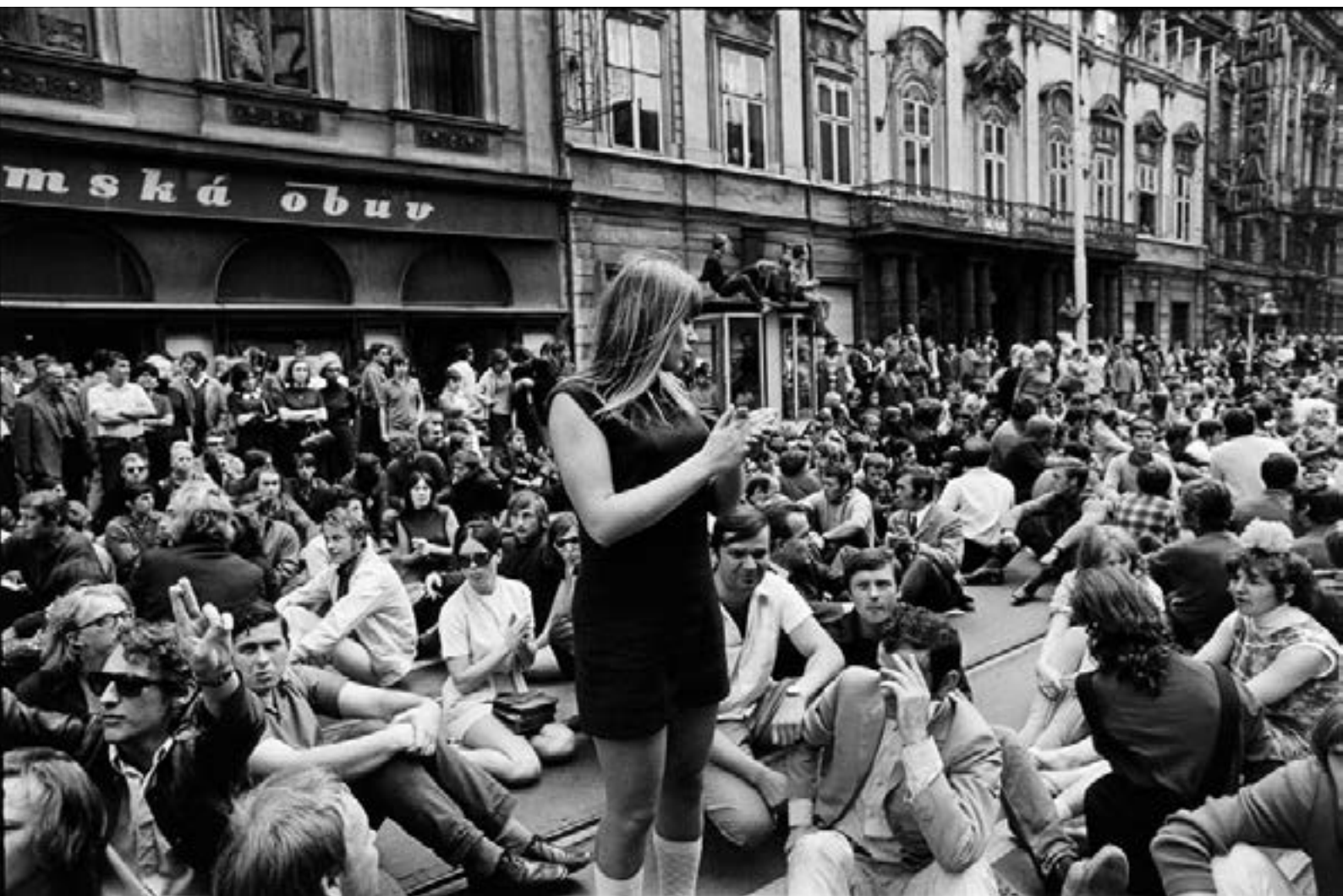
Manifestations antisoviétiques, Prague, Tchécoslovaquie, août 1969