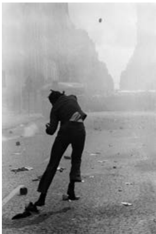
Manifestation, rue Saint-Jacques, Paris, 6 mai 1968

■ « D'un reportage à l'autre, la profession de photographe le fait circuler du monde de la rue à celui du spectacle, de la politique à la mode, des célébrités aux anonymes : sa vie est un montage d'observations dans laquelle sa sensibilité affleure.