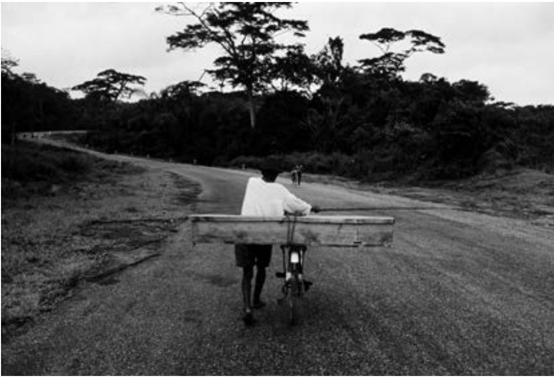
Guerre du Biafra, villageois ramenant un proche défunt, juillet 1968