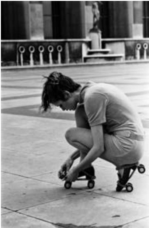
Le mannequin anglais Twiggy, Paris, mars 1967

membre de Magnum, tente de mettre en place une stratégie d'artiste pour diffuser les images de ses reportages réalisés au Rwanda, en Tanzanie et au Zaïre. Son livre, Le Silence , réunit cent photographies en noir et blanc, dépourvues de légende ou de texte explicatif, qui montrent les atrocités de la guerre : corps mutilés, cadavres, camps de réfugiés, etc. Les images sont exposées au Museum of Modern Art de New York (1995) et au Centre Georges-Pompidou sous la forme d'une gigantesque frise tirée de 104 exemplaires du livre. [...]