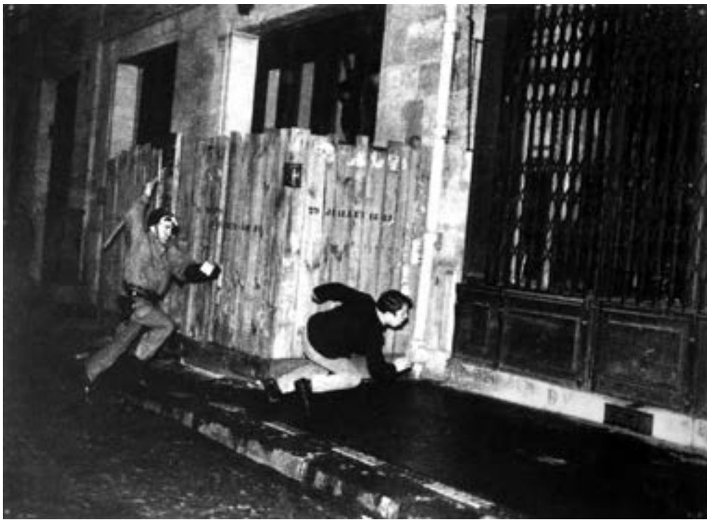
Manifestations, Paris, mai 1968