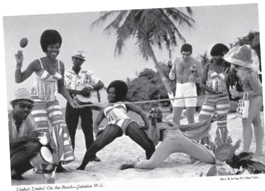
carte postale Limbol Limbol