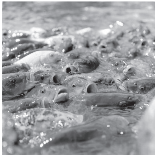
Rinko Kawauchi Untitled, 2001, de la série « Utatane » courtesy de l'artiste et Foil Gallery, Tokyo