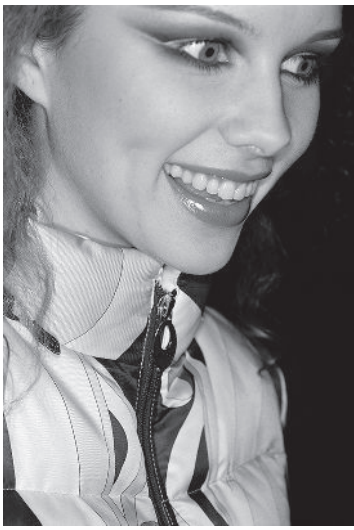
Martin Parr Russia. Moscow. Fashion Week, 2004 de la série « Luxury » © Martin Parr, Magnum Photos / Kamel Mennour