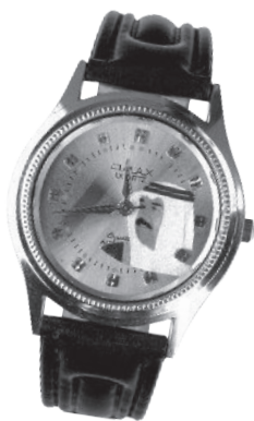
montre Sadam Hussein collection Martin Parr

Wenders, photographie dans deux directions : particulièrement pertinent dans le cas de Martin Parr, ce propos fonde en partie la légitimité de son travail. Celui-ci souligne d'ailleurs que ses œuvres peuvent être considérées à la fois comme une vision contemporaine de la société et un autoportrait. Au cours de ces années, pendant lesquelles il réalise des compositions complexes, sans indulgence à l'égard des modèles, Martin Parr intègre le vocabulaire de l'imagerie populaire et utilise jusqu'à l'excès les couleurs criardes, en dépit de l'opposition traditionnelle des cultures high et low . Parr se voit parfois reprocher d'associer à sa démarche documentaire une esthétique de la séduction qui recourt à l'exagération ou au grotesque. Il entend ainsi déjouer les pièges d'un supposé « bon goût », attitude qui l'a toujours conduit à s'intéresser à la rencontre entre les images et les objets – « souvenirs » ou « dérivés » –, et à accumuler les éléments décoratifs ou les ustensiles illustrés de son temps. Il cherche à faire apparaître tant les caractéristiques culturelles des différents pays que leur nivellement et leur globalisation. Le spectateur peut ainsi associer certains signes de la mondialisation avec des expériences visuelles, lier l'individuel au collectif et valoriser la singularité qui subsiste malgré tout dans les pratiques de chacun.