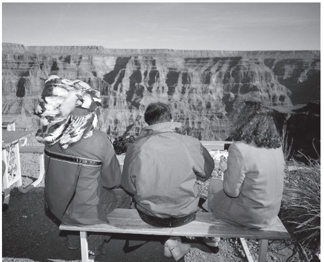
Martin Parr USA. Arizona. The Grand Canyon, 1994 de la série « Small World » © Martin Parr, Magnum Photos / Kamel Mennour

« J'éprouve [...] une grande attirance pour les objets éphémères. Leur signification et leur contexte culturel se modifient à mesure que le monde change. Beaucoup de ces objets sont en lien avec des personnes ou des événements qui renvoient à la gloire révolue d'époques et de lieux bien précis. Quand cette gloire s'enfonce dans le passé, l'objet prend une résonance nouvelle, et c'est ce phénomène qui est au cœur des collections présentées ici. » Dans le hall du Jeu de Paume, un choix d'objets à l'effigie de Barack Obama, pour certains vraiment extravagants, offre un exemple récent de la transformation d'éléments de consommation en slogans politiques. Préservatifs, produits alimentaires et cosmétiques affichant qu'« il est temps de faire un nettoyage » mêlent étrangement programme politique, sexualité et rituels corporels.