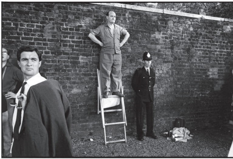
Tony Ray-Jones Trooping the Colour, London, 1967 © SSPL / NMeM / Tony Ray-Jones

Exposé et publié dans le monde entier, membre de l'agence Magnum depuis 1994, le photographe britannique Martin Parr a profondément modifié les valeurs et les thèmes de l'iconographie contemporaine, brouillant, dans une perspective décapante, les distinctions entre art et culture populaire. Avec les travaux qu'il a réalisés pour la presse et grâce à ses nombreuses séries documentaires, il a ouvert le photoreportage à des sujets de société tels que la consommation, les loisirs, les transports de masse ou le luxe. Photographe prolifique et réputé, Martin Parr est aussi un prescripteur : il consacre une part active de son temps à explorer la scène artistique, s'intéressant autant aux démarches méconnues ou récentes qu'aux figures historiques. L'orientation et l'étendue de sa collection personnelle affirment sa vision peu orthodoxe de l'image, à la fois critique et empathique. Une partie du corpus considérable et envahissant entreposé dans sa maison de Bristol, qu'il conçoit comme le matériau d'un travelling museum (les quarante et une expositions simultanées de sa série « Common Sense » sont inscrites au Livre des records), est exposée ici selon un principe thématique. La passion de Martin Parr pour les livres de photographies – il possède un ensemble unique au monde qu'il complète au fil de ses voyages – relève selon ses propres mots d'une véritable addiction. Sa collection s'étend aux