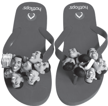
Barack Obama Ephemera, 2009 collection Martin Parr