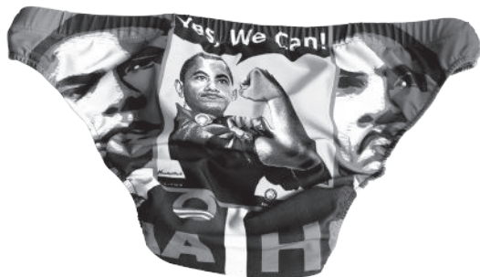
Barack Obama Ephemera, 2009 collection Martin Parr