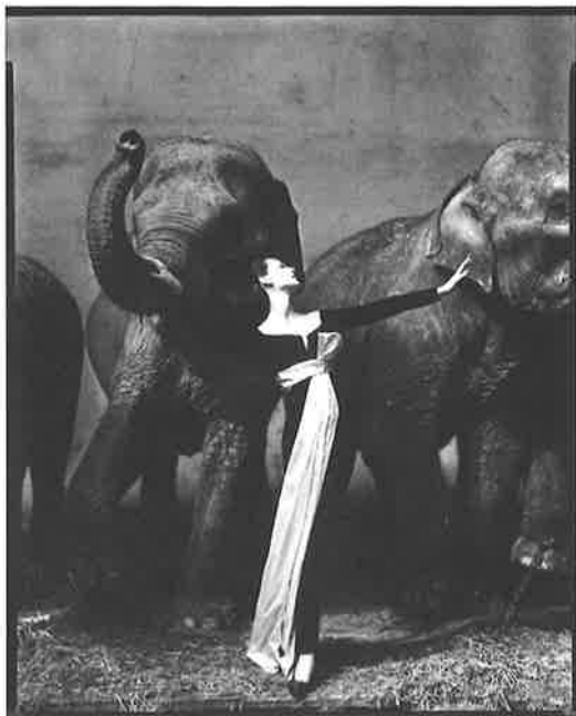
Dovima avec les éléphants, robe du soir de Dior Cirque d'Hiver, Paris, août 1955