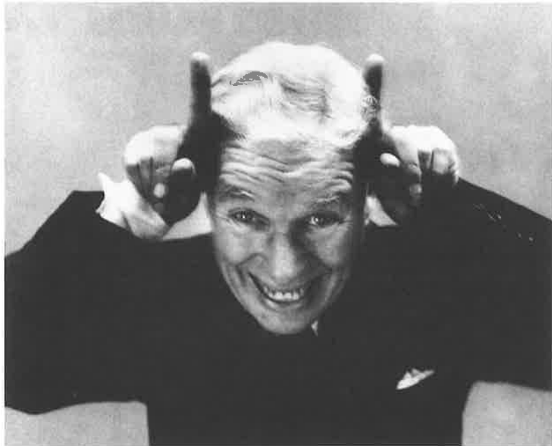
Charles Chaplin quittant l'Amérique New York, 13 septembre 1952

« Un portrait n'est pas une ressemblance.