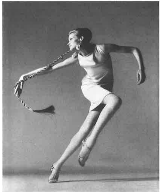
Veruschka, robe de Kimberly

132 e Rue et FDR Drive, Harlem, New York, 4 novembre 1963