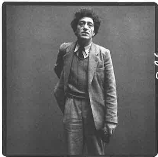
Alberto Giacometti, sculpteur Paris, 6 mars 1958