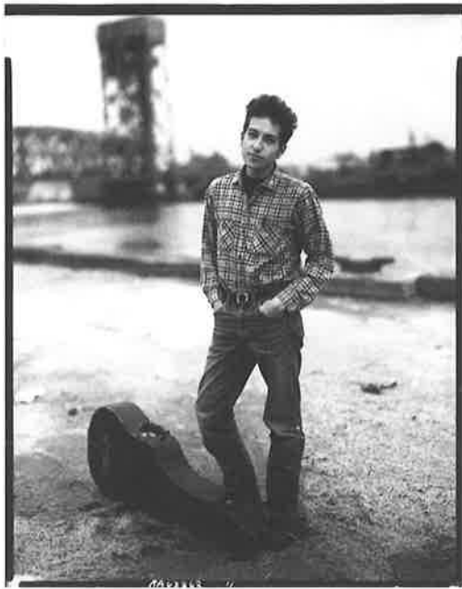
Bob Dylan, musicien

132 e Rue et FDR Drive, Harlem, New York, 4 novembre 1963