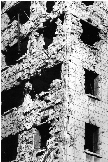
Beyrouth, Photographies, 1984