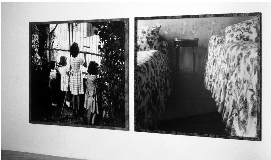
Vulaines I, 1989