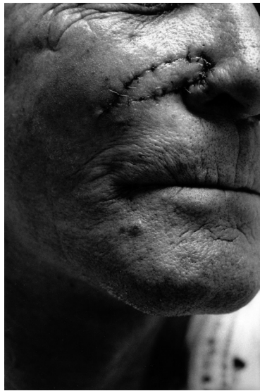
Every One #8, 1994

L'œuvre photographique de Sophie Ristelhueber est depuis le début des années 1980 identifiée à des images fortes et retenues qui traitent, sans les raconter, des réalités complexes du monde contemporain. Cette pratique exigeante s'est prolongée dans d'autres médiums, selon le même souci d'économie de moyens. Sophie Ristelhueber a en effet réalisé des films et des vidéos, travaillé avec le son et créé des installations ; elle agrandit souvent, à l'occasion d'une exposition, la photographie aux dimensions du « tableau », parfois sous forme d'affiches collées directement sur les murs. Elle a publié une douzaine de livres d'artiste, pour elle aussi importants que la mise en espace de ses expositions, et dont elle choisit les formats comme les textes.