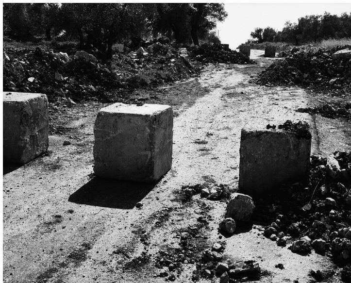
W B #24, 2005

prises au ras du sol, des énormes cratères causés par l'explosion, lui inspirent ces images qui utilisent parfois des morceaux de paysages photographiés au cours de son voyage irakien en 2000, ou des éléments hétéroclites de précédents voyages.