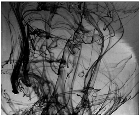
5. Don't Do to Her What You Did to Me (détail), 1998-2001