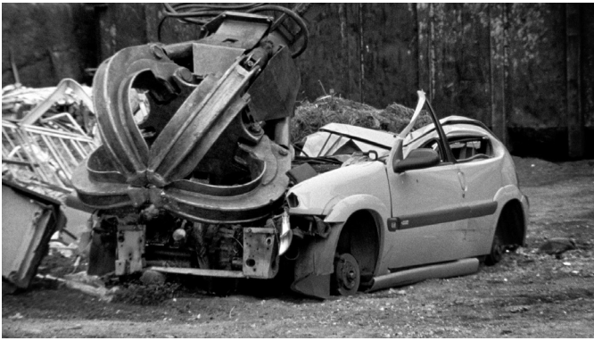
7. The End of the Road (détail), 2010