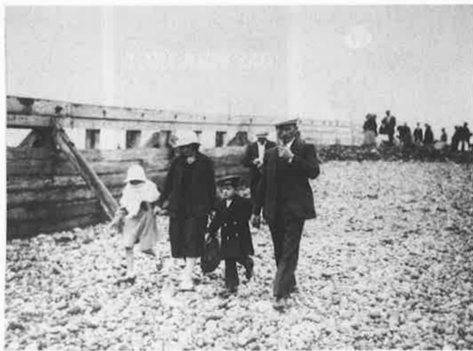
« Le week-end des pauvres » au Tréport, 2 septembre 1936, Paris, Bibliothèque nationale, Département des Estampes et de la Photographie

Thomas Ruff , jpegny02 , 2004, C-Print, New York, David Zwirner Gallery © ADAGP, Paris 2007