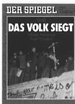
Der Spiegel, 13 novembre 1989