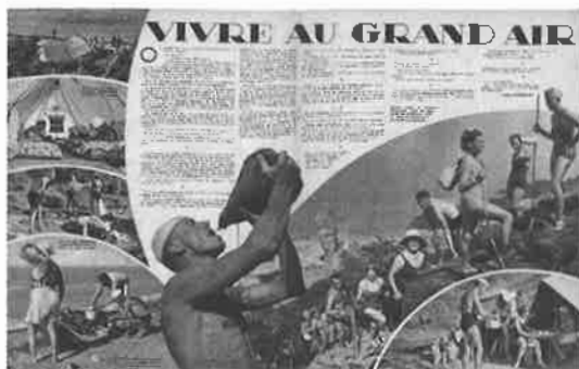
Vailò, 6 août 1937, Montreuil, Musée de l'Histoire vivante