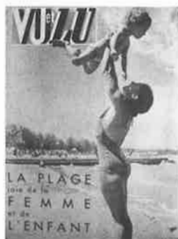
Vu, 7 août 1939, Montreuil, Musée de l'Histoire vivante