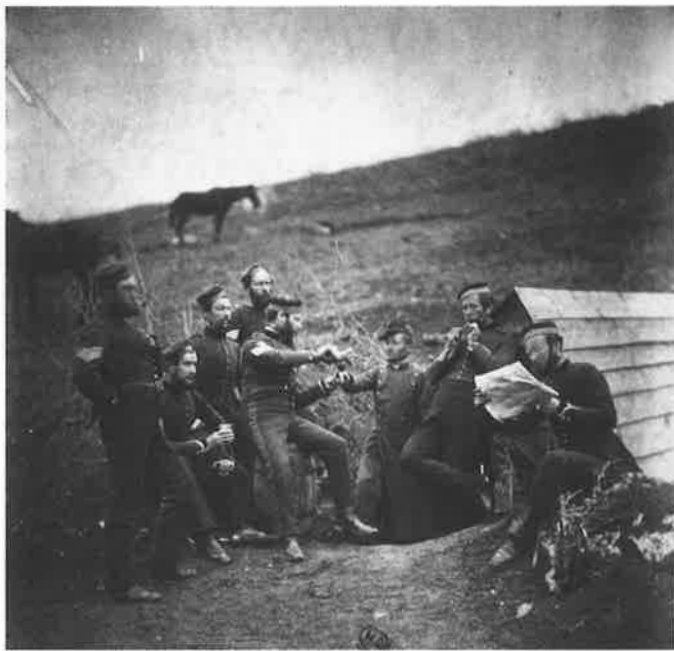
Roger Fenton , Ouvert de Crimée : Incidents of camp life: l'Entente cordiale , 1855, Musée d'Orsay, Paris