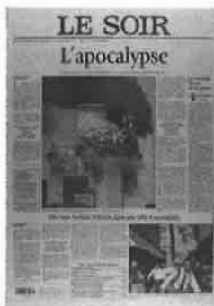
Le Soir, 12 septembre 2001