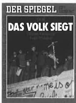
Der Spiegel, 13 novembre 1989