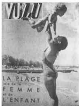
VU, 2 août 1939, Montreuil, Musée de l'Histoire vivante