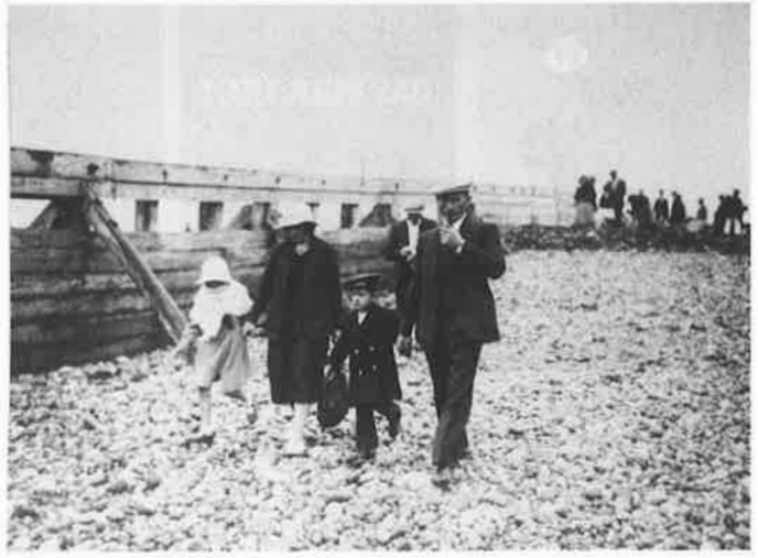
« Le week-end des pauvres » au Tréport, 2 septembre 1936, Paris, Bibliothèque nationale, Département des Estampes et de la Photographie

Thomas Ruff , jpegny02 , 2004, C-Print, New York, David Zwirner Gallery © ADAGP, Paris 2007