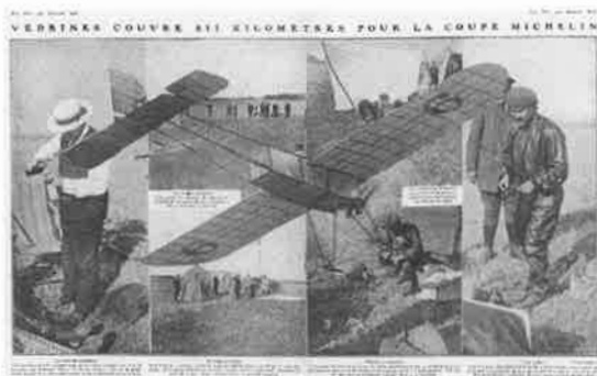
La Vie au grand air, 19 août 1911