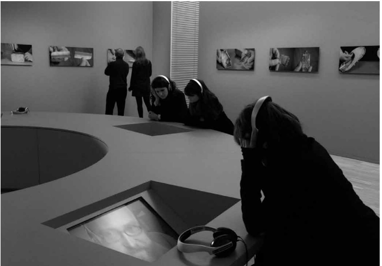
MenschenDinge [L'Aspect humain des choses], 2004-2006. Vue de l'installation au Jeu de Paume, 2010. Collection des Mémoriaux de Buchenwald et de Mittelbau-Dora, Weimar.