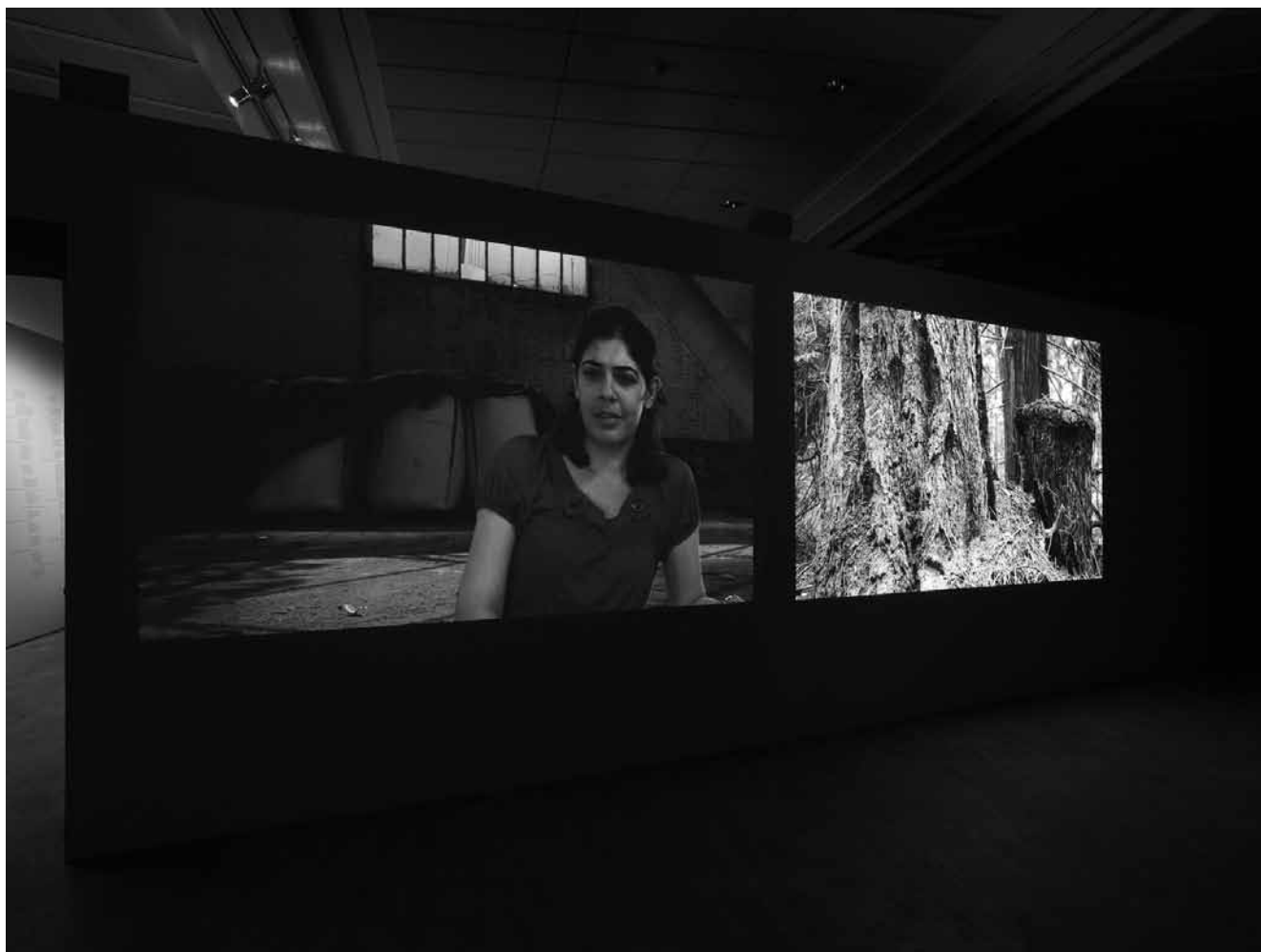
D'eux , 2010. Vue de l'installation au Jeu de Paume. Production Jeu de Paume / courtesy galerie Baudouin Lebon, Paris. Photo Arno Gisinger © Jeu de Paume.