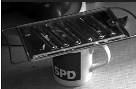
Anri Sala, Intervista , 1998. Courtesy galerie Chantal Crousel, Paris © Anri Sala.