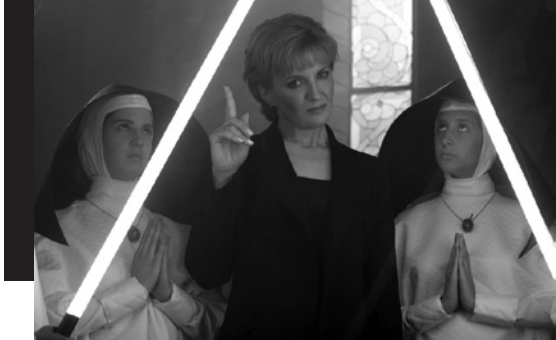
Martin Sastre, Diana: The Rose Conspiracy , 2005. Courtesy galerie Les filles du Calvaire, Paris © Martin Sastre.