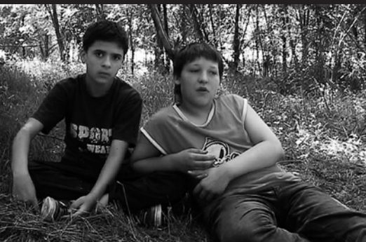
Ming-Yu Lee, Home Not Yet Arrived , 2010. Courtesy Centre culturel de Taïwan à Paris © Ming-Yu Lee.