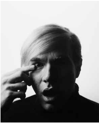
Andy Warhol, 1968