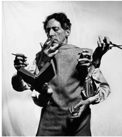
Jean Cocteau, l'artiste multidisciplinaire, 1949

démarche créative, propre à la photographie, pour défendre la profession. Il y consacre un ouvrage publié en 1961, Halsman on the Creation of Photographic Ideas , et y présente ses innovations telles que le « picture book » et la « jumpology ».