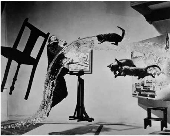
Dalí Atomicus , 1948 Musée de l'Élysée