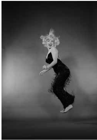
Ballet aquatique, 1953