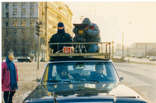
Photographie de tournage D'Est 1993.

Commissaires : Laurence Rassel et Marta Ponsa. Exposition conçue par Bozar, la Fondation Chantal Akerman et CINEMATEK, Bruxelles, et réalisée en collaboration avec le Jeu de Paume pour sa présentation à Paris.