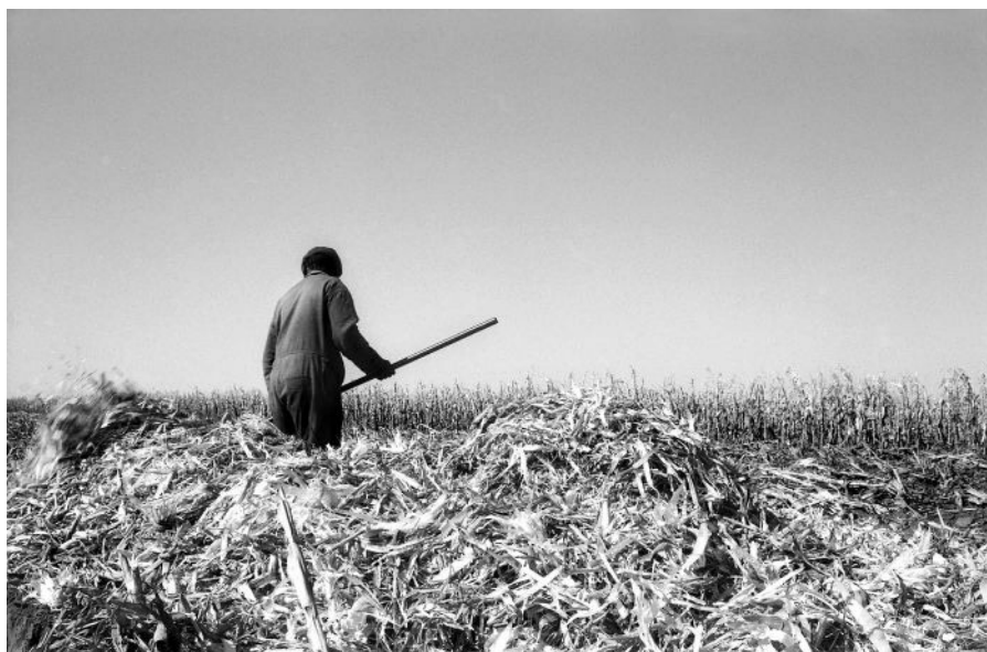
3. Jo Ractliffe N1 somewhere between Winburg and Ventersburg , 1982 tirage gélatino-argentique