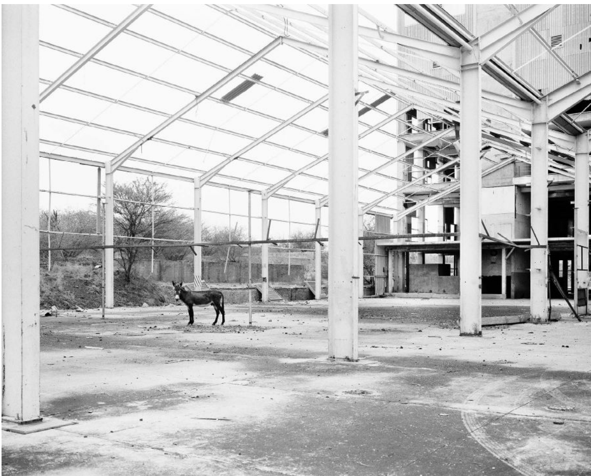
10. Jo Ractliffe Donkey, Pomfret, 2011 de la série The Borderlands tirage gélantino-argentique