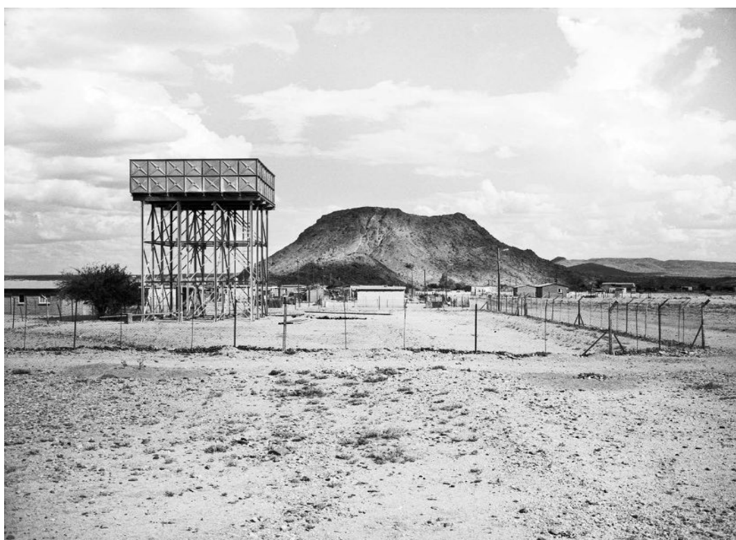
12. Jo Ractliffe Water tank, Riemvasmaak , 2012 de la série The Borderlands tirage gélatino-argentique d'époque