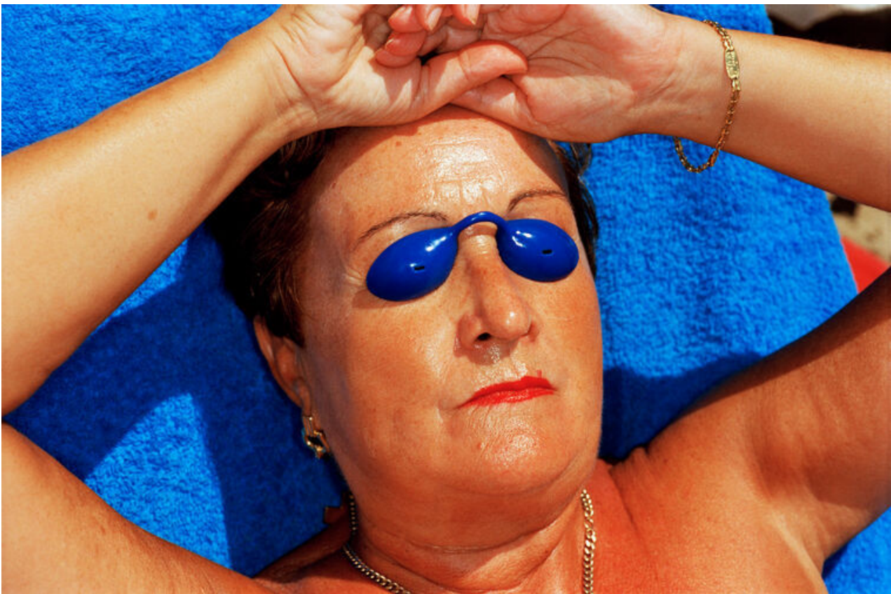
Benidorm, Espagne, 1997

Pendant la première semaine des vacances d'hiver et de printemps :