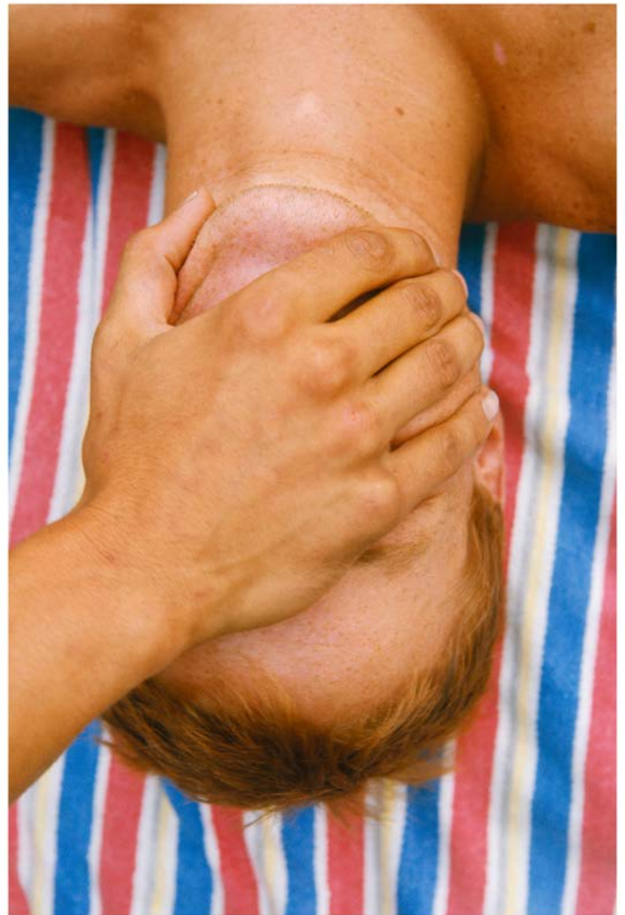
4. Walter Pfeiffer Untitled , 1975 © Walter Pfeiffer