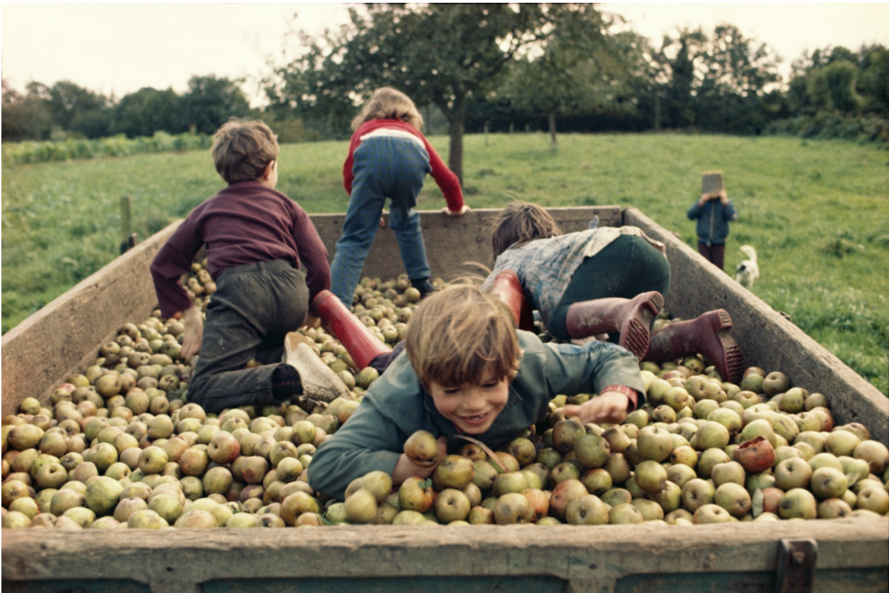
Madeleine de Sinéty, La Charrette de pommes , Poilly, 1974 © Succession Madeleine de Sinéty

Pendant la première semaine des vacances d'été :